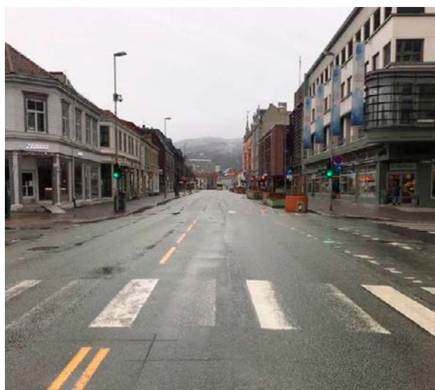
Stemningsbilde fra Olav Tryggvassons gate, Trondheim onsdag, 01.04.2020. kl. 1145 i covid 19 modus.